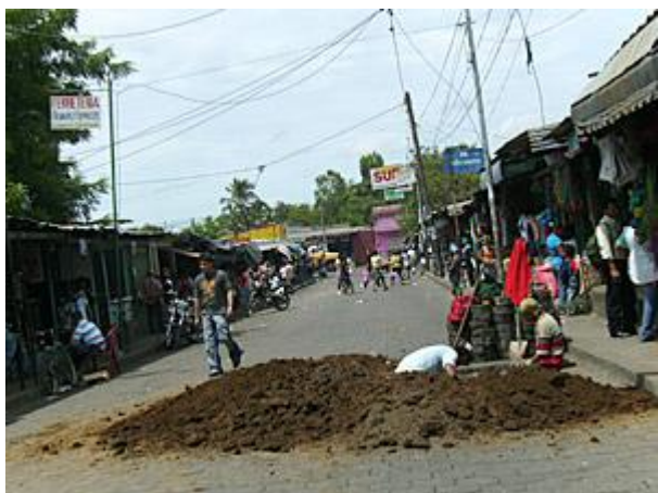
Construcción de pozos recolectores para el alcantarillado sanitario en la primera calle.