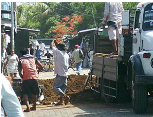
Acarreo de materiales en la II calle de la Terminal de buses.