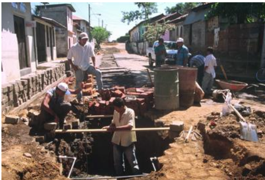
Construcción de alcantarillado

El gobierno municipal esperaba conseguir una gestión e inversión más eficiente y mejorar la coordinación entre los actores dentro del sector para evitar duplicaciones de esfuerzo y lograr el cumplimiento de los metas de milenio. La Alcaldía propuso definir en conjunto con los distintos actores una estrategia sostenible para el manejo de los recursos hídricos del Municipio de León.