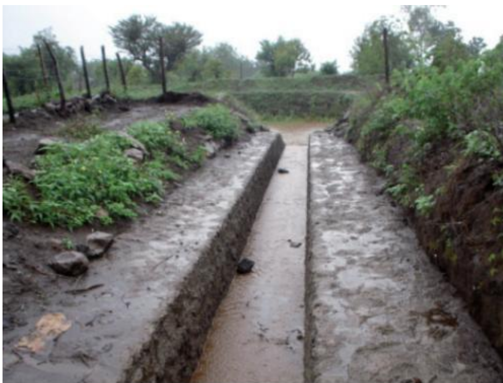
Canal de drenaje pluvial.

El municipio de León ha logrado durante los últimos años buenas inversiones en el tema de saneamiento urbano, pero lamentablemente las plantas de tratamiento no realizan su debida función. Esto es por causa de las descargas de las aguas pluviales y las basuras en las tuberías de recolección, provocando obstrucciones en el sistema; además de que los sistemas están sobrecargados en el tratamiento y no existe posibilidad de ampliación de las plantas por las limitantes de terrenos. También hace falta un programa de extracción de lodos en las plantas. La inversión en la parte de mantenimiento ha sido insuficiente y la ampliación del sistema tanto en las redes de tubería como en los equipos de producción ha quedado atrás.