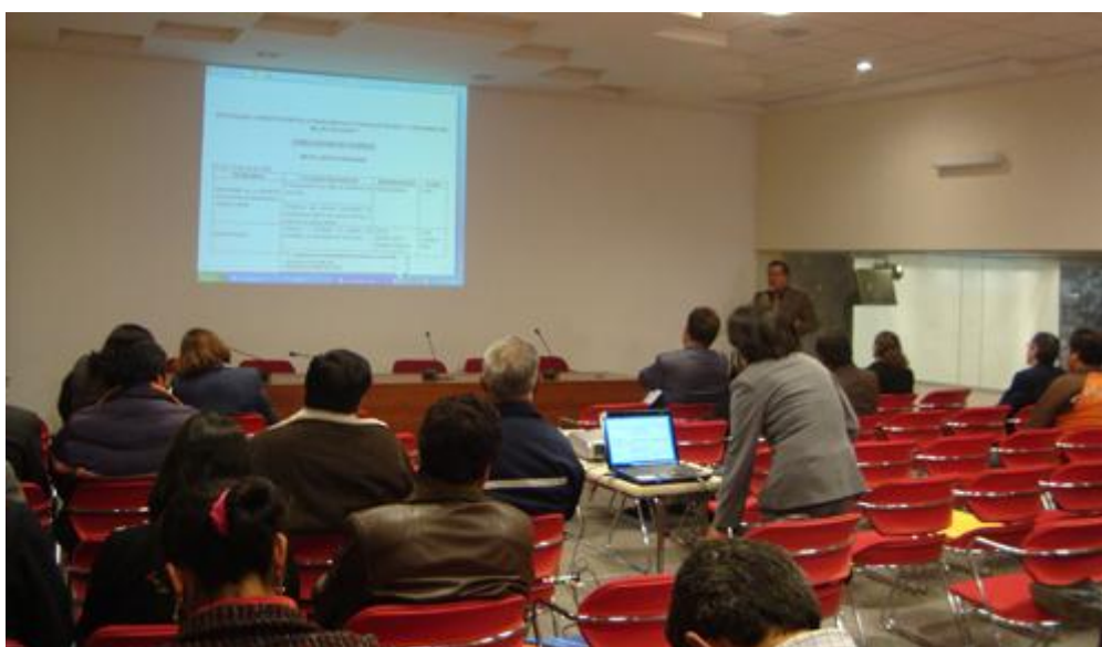
Reunión de compromiso para actualizar el PIGARS

2. La formulación concertada y participativa del PIGARS, facilitada por el Centro Guaman Poma, ha permitido que los representantes de las diferentes instituciones participantes asuman el compromiso de continuar con el trabajo que desarrollan a fin de que permanentemente sea retroalimentada. El PIGARS se constituye como el primer instrumento generado participativamente para la gestión de los residuos sólidos en la historia de la ciudad del Cusco.