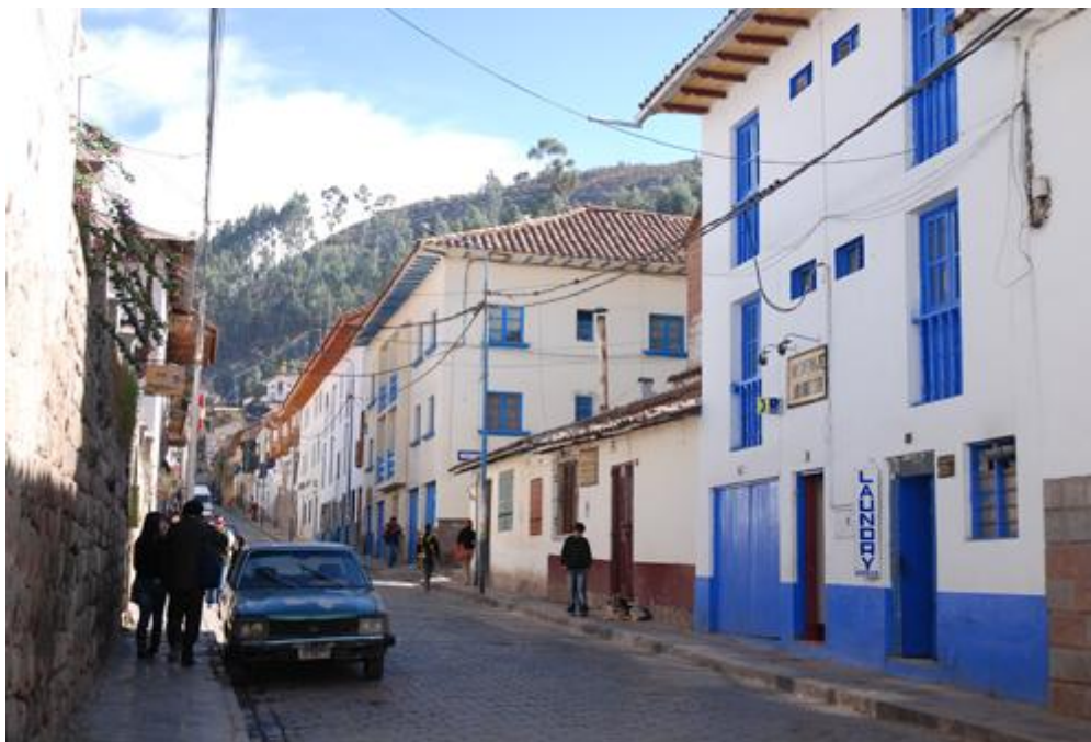
Calle de Cusco