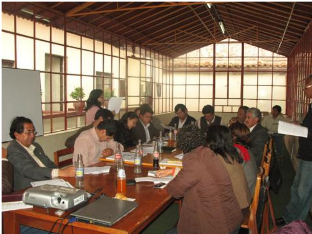
Reunión del subcomité de alternativas