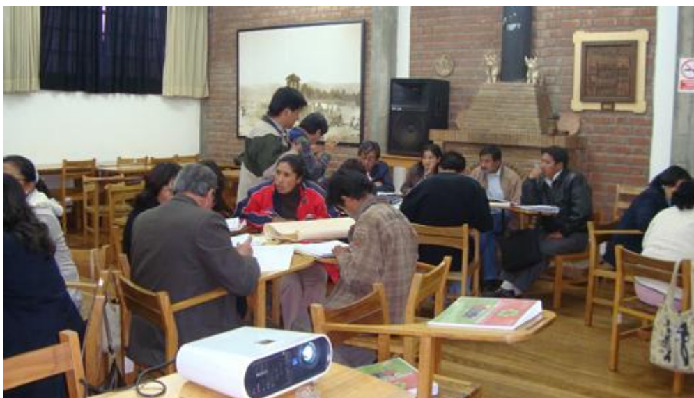
Capacitación a funcionarios

5. La implementación del programa modular de especialización en gestión y gerencia de residuos sólidos urbanos, lo que ha permitido contribuir al desarrollo de las capacidades de 30 funcionarios públicos, quienes vienen generando iniciativas, en base a la aplicación de herramientas de gestión, tales como plan de sensibilización, estructura de costos, plan de supervisión y monitoreo entre otros. Ello va a contribuir de manera sustancial en la mejora continua y progresiva de la gestión de los residuos sólidos en cada uno de sus municipios.