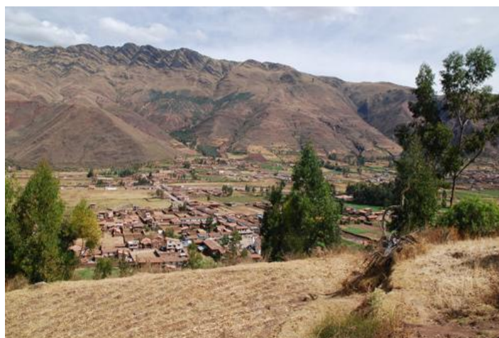
Subcuenca del río Huatanay