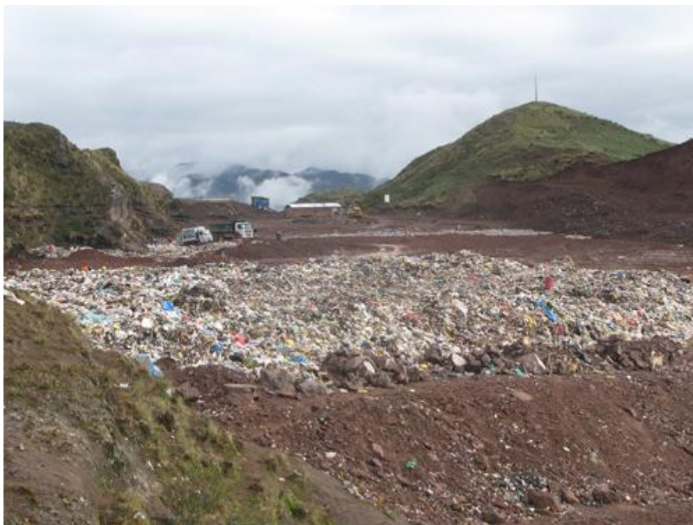
Situación actual del botadero de Haquira

Prevalecen y se incrementan prácticas tradicionales orientadas hacia el consumismo, prácticas y hábitos poco saludables y poco amigables con el ambiente. Uno de los impactos de esta inadecuada acción del hombre es la generación e inadecuada gestión de los residuos sólidos en general. En la sub cuenca Huatanay al 2009, se genera 340 TN/día de residuos sólidos urbanos, de los cuales el 88% es dispuesto en el botadero de Haquira (“botadero” es el área que se utiliza para la disposición final de los residuos sólidos, sin ningún tipo de prevención de la contaminación de suelos, acuíferos, aire y otros) y el 12% en las quebradas, ríos y otros espacios públicos, poniendo en riesgo la salud de la población, por los efectos de la contaminación del aire, la presencia de roedores, la contaminación de acuíferos y otros cuerpos de agua y ríos.