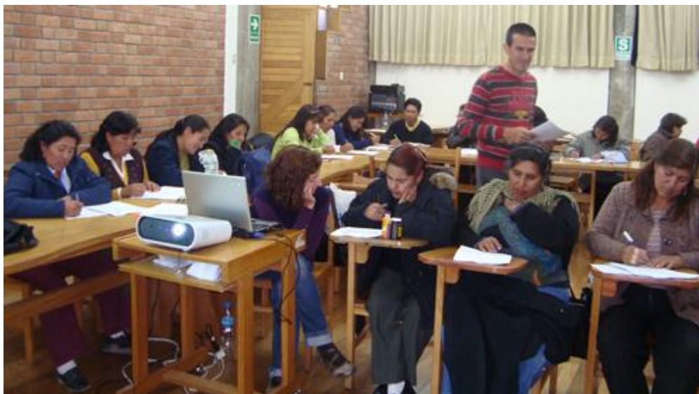
Taller de buenas prácticas en el manejo de RRSS a profesores de Inst. Educativas

7. Producto de las acciones de educación y sensibilización, se ha generado una gran demanda de las instituciones educativas, por recibir cursos formativos dirigido a la comunidad educativa (profesores, administrativos, estudiantado y padres y madres de familia). Esta demanda se podría tangibilizar y hacer que se convierta en una política educativa y que sea incorporada como tal dentro de la estructura curricular.