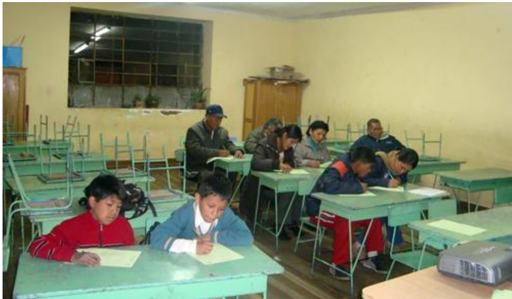
Taller a familias de Santiago para minimizar la generación de RRSS plásticos