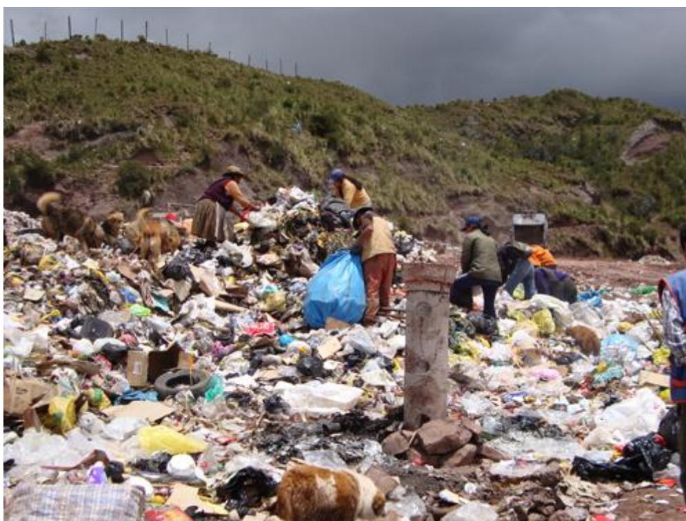
Presencia de recicladores en el botadero de Haqira

Para la disposición final existe un botadero clausurado de San Antonio, que dejó de funcionar en 2002, y en su lugar se puso en marcha otro botadero "oficial" ubicado en la cabecera de la micro cuenca de Haqira. Este botadero no considera los parámetros mínimos de funcionamiento, como la impermeabilización del suelo, el tratamiento de lixiviados, no cuenta con los respectivos respiraderos y menos se tratan los gases generados en el proceso de descomposición. Los efectos inmediatos son la contaminación de aire, de los suelos y aguas con los lixiviados, y son puntos de concentración de animales (canes y otros ganados que pastan en los alrededores).