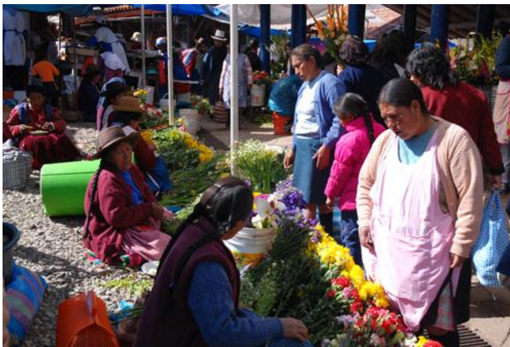
Mercado en el Valle de Cusco