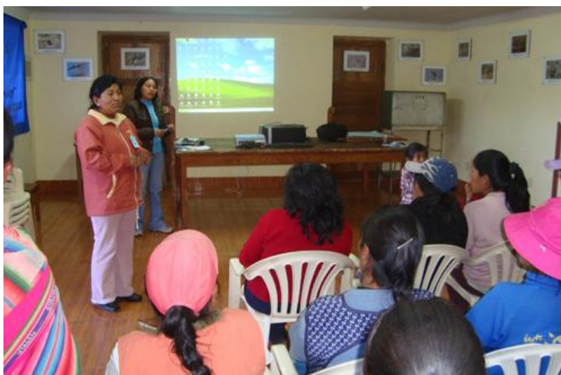
Capacitación a trabajadores del servicio de limpieza

5. El apoyar la conformación y formalización de las pequeñas y micro empresas de recicladores, sobre la base de iniciativas generadas en el proceso de implementación del proyecto y el Curso de Especialización en la Gestión Integral de los Residuos Sólidos, abre grandes posibilidades que contribuyen a generar empleo digno y a la vez contribuye a que las municipalidades deleguen en el sector privado la tarea de recolección selectiva, reciclaje y educación a la ciudadanía y al mismo tiempo permitirá a que las municipalidades gestionen de mejor forma la labor que asumen en la actualidad.