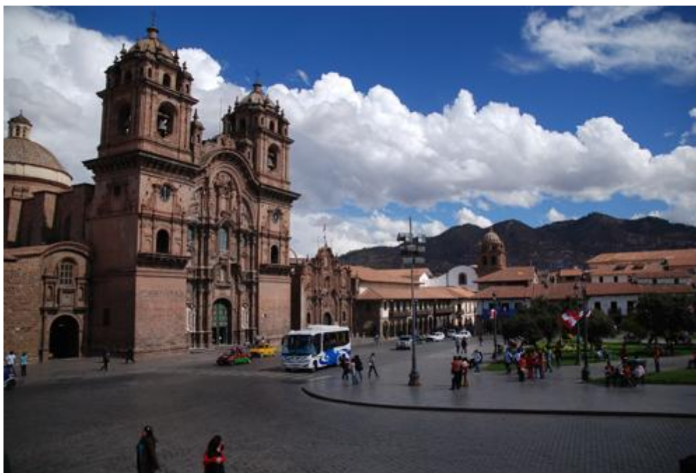
Plaza de Armas de Cusco