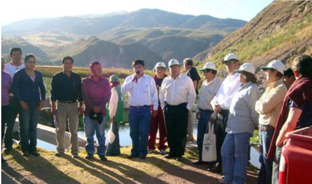
Diagnóstico de la contaminación por RRSS del río Huatanay

2. Incidir en los tomadores de decisiones a fin de que la sistematización de los resultados, se convierta en política municipal y que los proyectos piloto sean replicados a nivel de los distritos, la provincia y la región, incidiendo en una mayor articulación con la gestión del territorio y la gestión integrada de los recursos naturales, de la cual sea parte la gestión integral de los residuos sólidos.