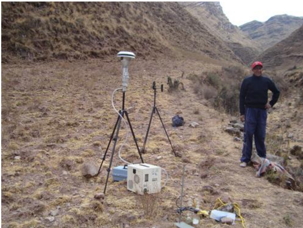
Toma de muestra para análisis de laboratorio