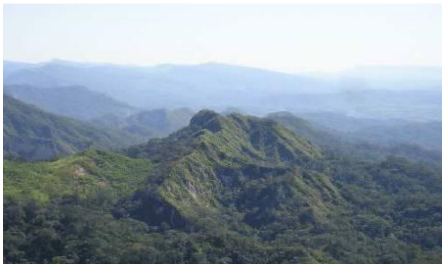
Área protegida municipal Parabanocito, Municipios El Torno y Samaipata.