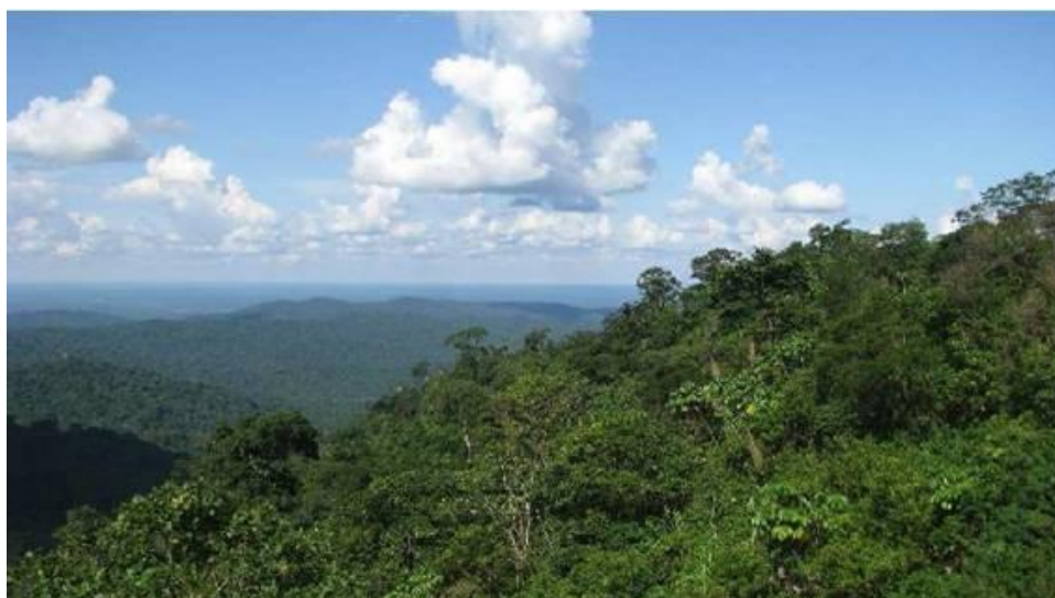
Bosque Amazónico Preandino, Municipio San Borja.

El corredor ecológico de conservación Vilcabamba – Amboró, compartido entre Bolivia y Perú, es uno de los lugares biológicamente más diversos del planeta; el corredor tiene una superficie aproximada de 30 millones de hectáreas, desde la Cordillera Vilcabamba en Perú hasta el Parque Nacional Amboró en Bolivia se encuentra ubicado en los Yungas Boliviano – Peruanos. El área de intervención del proyecto se encuentra ubicado en el sector boliviano del corredor y abarca 3 áreas protegidas locales: