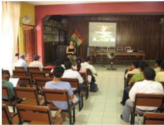
1º Taller capacitación con técnicos del Gran Concejo Tsimane y subalcaldía del Distrito indígena Tsimane.

Otro logro importante del proyecto, es la consolidación de la red de intercambio www.redmunicipalverde.org con esta herramienta, los gobiernos municipales no sólo del Corredor sino de todo el país, tienen la posibilidad y facilidad de acceder a un compendio importante de información legal y técnica como fuente de consulta para encarar aspectos relacionados a la Gestión Ambiental Municipal, y a la gobernanza de áreas protegidas municipales.